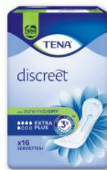
SERVIETTES DISCREET EXTRA PLUS X16 TENA