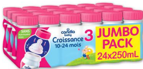
BABY CROISSANCE 3 JUMBO CANDIA 24 x 25cl - soit 6 l