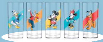
SET DE 5 VERRES