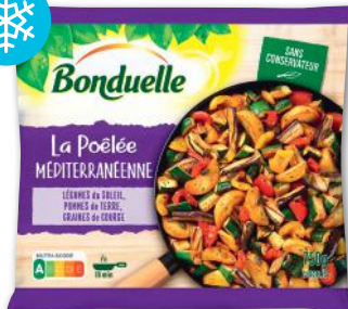
LA POÊLÉE MÉDITERRANÉENNE SURGELÉE BONDUELLE 750 g