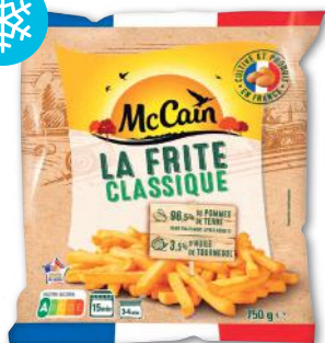
LA FRITE CLASSIQUE SURGELÉE MC CAIN 750 g