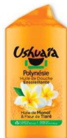
HUILE DE DOUCHE ENSOLEILLANTE HUILE DE MONOÏ & FLEUR DE TIARÉ USHUAIA 300 ml