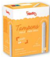
TAMPONS NORMAUX AVEC APPLICATEUR X32 NETTO