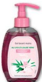
GEL LAVANT MAINS LYS ET ALOE VERA NETTO 300ml - soit 300 ml