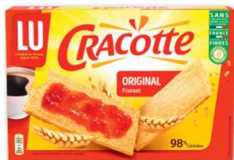
CRACOTTE FROMENT LU 250 g