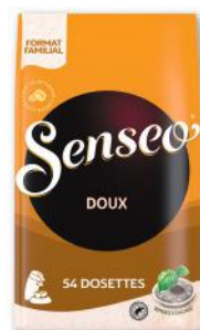
DOSETTES DE CAFÉ DOUX SENSEO 375 g