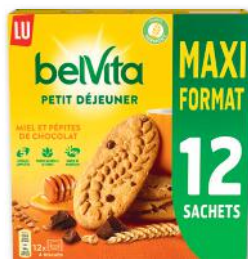
BISCUITS PETIT-DÉJEUNER MIEL ET PÉPITES DE CHOCOLAT LU 650 g