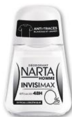
DÉODORANT HOMME BILLE INVISIMAX 0% NARTA 50 ml