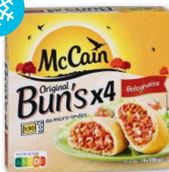
ORIGINAL BUN'S BOLOGNAISE SURGELÉ MC CAIN 4 x 100 g