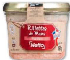
RILLETES DU MANS NETTO 180 g