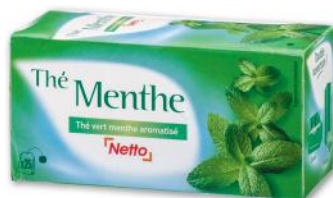
THÉ MENTHE NETTO 44 g