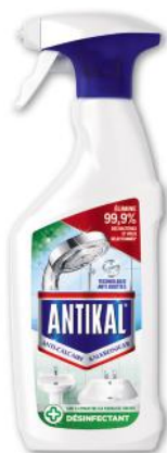
SPRAY ANTI-CALCAIRE DÉSINFECTANT ANTIKAL (b) 500 ml