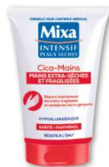
CICA MAINS EXTRA SÈCHES ET FRAGILISÉES MIXA 50 ml