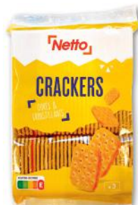
CRACKER'S DORÉS & CROUSTILLANTS NETTO 3 x 100 g - soit 300 g