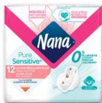
SERVIETTES HYGIÉNIQUES PURE SENSITIVE X12 NANA