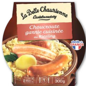
CHOUCROUTE GARNIE AU RIESLING LA BELLE CHAURIENNE 300 g