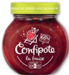
CONFIPOTE LA FRAISE MATERNE 350 g