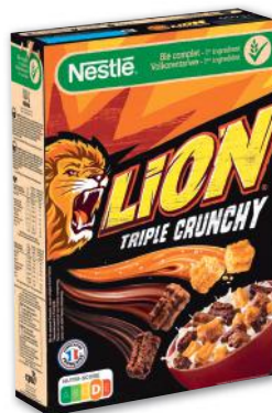
LION TRIPLE CRUNCHY NESTLÉ 550 g