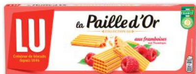
PAILLE D'OR AUX FRAMBOISES LU 170 g