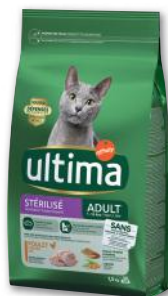
CROQUETTES CHAT STÉRILISÉ ADULTE POULET ULTIMA 1,5 kg