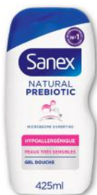
GEL DOUCHE NATURAL PREBIOTIC HYPOALLERGÉNIQUE SANEX 425 ml