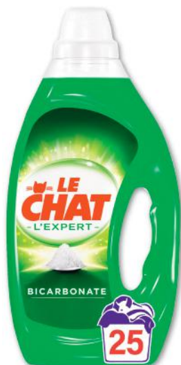
LESSIVE LIQUIDE L'EXPERT BICARBONATE 25 LAVAGES LE CHAT (b) 1,25 l