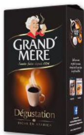
CAFÉ MOULU DÉGUSTATION GRAND'MÈRE 250 g