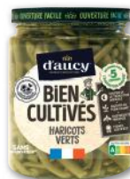
HARICOTS VERTS BIEN CULTIVÉS D'AUCY 290 g