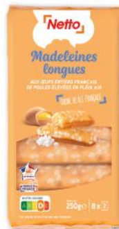
MADELEINES LONGUES AUX PERLES DE SUCRE NETTO 250 g