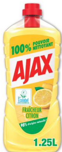
NETTOYANT MÉNAGER FRAÎCHEUR CITRON AJAX (b) 1,25 l