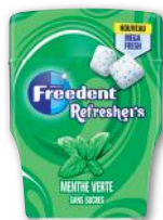
CHEWING-GUM MENTHE VERTE FREEDENT 67 g