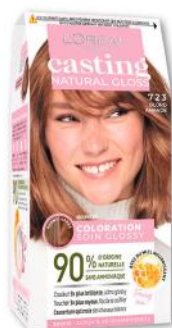
COLORATION NATURAL GLOSS 723 BLONDE AMANDE L'OREAL CASTING (b)