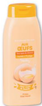
SHAMPOOING TRÈS DOUX AUX OEUFS NETTO 500 ml