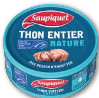
THON ENTIER NATURE MSC SAUPIQUET 112 g