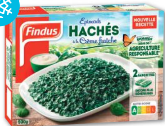
ÉPINARDS HACHÉS À LA CRÈME FRAICHE SURGELÉS FINDUS 500 g