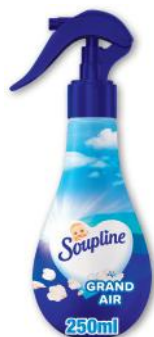
SPRAY PARFUM DE LINGE GRAND AIR SOUPLINE (b) 250 ml