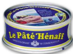
PÂTÉ DE PORC AU SEL DE GUÉRENDE HÉNAFF 78 g