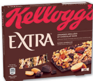
EXTRA BARRE GÉNÉREUSE AMANDES GRILLÉES ET CHOCOLAT NOIR KELLOGG'S 4 x 32 g - soit 128 g