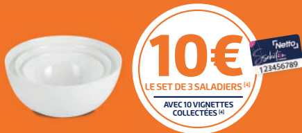
Set de 3 saladiers gigognes 17-21-25 cm