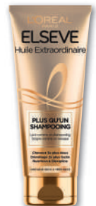
HUILE EXTRAORDINAIRE SHAMPOOING 2 EN 1 TUBE ELSEVE 250ml