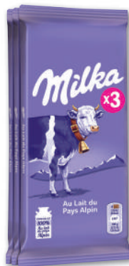
TABLETTES DE CHOCOLAT AU LAIT DU PAYS ALPIN MILKA 3 x 100 g - soit 300 g