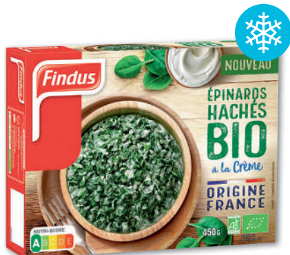
ÉPINARDS HACHÉS BIO À LA CRÈME SURGELÉS FINDUS 450 g