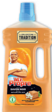
NETTOYANT DILUÉ TRADITION SAVON NOIR (b) MR PROPRE 1 l