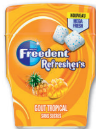
CHEWING GUM TROPICAL FREUDENT 67 g