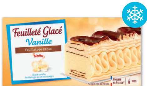
FEUILLETÉ GOÛT VANILLE SURGELÉ NETTO 328 g