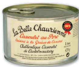
CASSOULET AU PORC CUISINÉ À LA GRAISSE DE CANARD LA BELLE CHAURIENNE 420 g