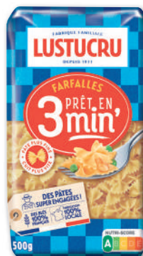
PÂTES CUISSON RAPIDE FARFALLE LUSTUCRU 500 g