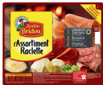
ASSORTIMENT RACLETTE JUSTIN BRIDOU 260 g