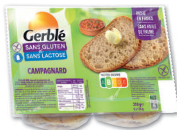
PAIN SANS GLUTEN CAMPAGNARD À LA FARINE DE SARRASIN GERBLÉ 2 Sachets - soit 350 g