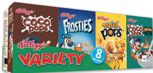
CÉRÉALES VARIETY KELLOGG'S 215 g