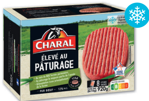
STEAK HACHÉ ÉLEVÉ AU PATURAGE SURGELÉ CHARAL 920 g