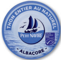
THON MSC AU NATUREL PETIT NAVIRE 112 g