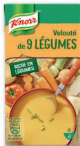
VELOUTÉ DE 9 LÉGUMES KNORR 500 ml