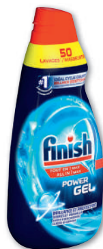
GEL LAVE-VAISSELLE POWER TOUT-EN-1 MAX (b) FINISH 50 lavages 1,1 l