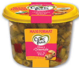
OLIVES À L'ORIENTALE CROC'FRAIS maxi format - soit 500 g