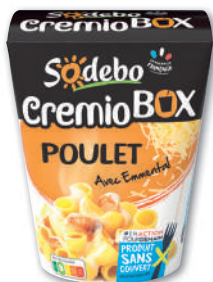
CREMIO BOX POULET À LA CRÈME SODEBO 280 g