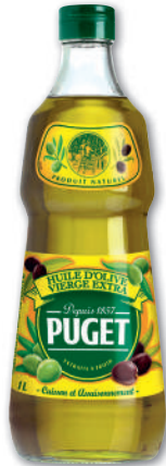
HUILE D'OLIVE EXTRA VIERGE PUGET 1 l