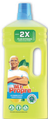
NETTOYANT MENAGER CITRON D'ÉTÉ (b) MR PROPRE 1,3 l