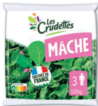
MÂCHE LES CRUDETTES 100 g