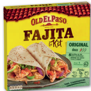
KIT FAJITA ORIGINAL OLD EL PASO 500 g