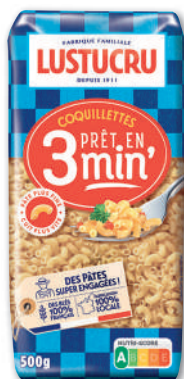
PÂTES CUISSON RAPIDE COQUILLETES LUSTUCRU 500 g