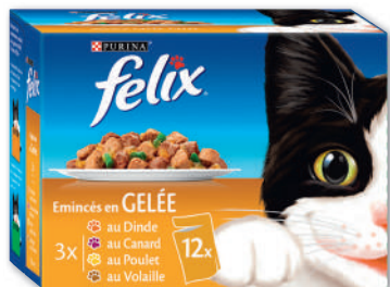
PÂTÉE POUR CHAT ASSORTIMENT VIANDES FELIX 1,2 kg