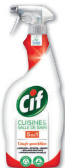
PISTOLET CUISINE ET SALLE DE BAIN 5 EN 1 (b) CIF 750 ml