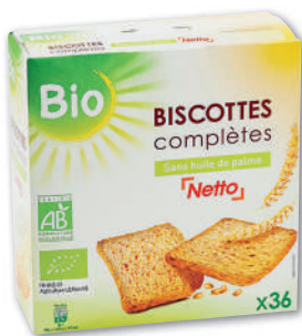
BISCOTTES COMPLÈTES BIO SANS HUILE DE PALME NETTO 300 g