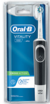
BROSSE À DENT ÉLECTRIQUE VITALITY 100 CROSS ACTION BLACK ORAL B