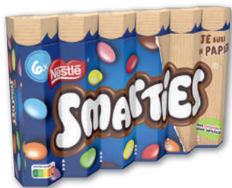
BOÎTE DE DRAGÉES HEXATUBE SMARTIES 6 x 34 g - soit 204 g