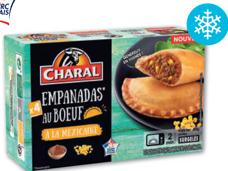
EMSPANADAS AU BŒUF À LA MEXICAINE SURGELÉ CHARAL 400 g