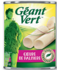
CŒURS DE PALMIERS SANS CONSERVATEURS GÉANT VERT 220 g