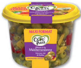
OLIVES À LA MÉDITERRANÉENNE CROC'FRAIS maxi format - soit 500 g