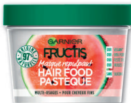
HAIRFOOD MASQUE PASTÈQUE FRUCTIS 390ml