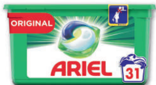
LESSIVE PODS 31D ORIGINAL (b) ARIEL 781,20 g