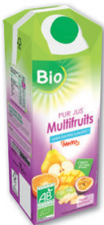
PUR JUS MULTIFRUITS BIO NETTO 75 cl