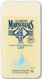
BAIN DOUCHE LAIT LE PETIT MARSEILLAIS 250 ml