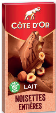
TABLETTE DE CHOCOLAT LAIT NOISETTES ENTIÈRES CÔTE D'OR 180 g