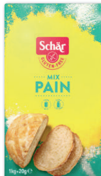
FARINE A PAIN SCHAAR 1 kg