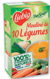
MOULINÉ DE 10 LÉGUMES VARIÉS LIEBIG 1 l