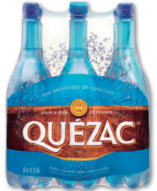
EAU MINÉRALE NATURELLE GAZEUSE QUÉZAC 6x1,15L - soit 6,9 l