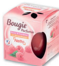
BOUGIE PARFUMÉE NECTAR DE FRAMBOISE NETTO