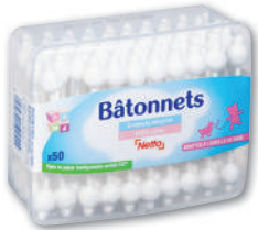
BÂTONNETS EMBOUITS SÉCURITÉ BÉBÉ X50 NETTO